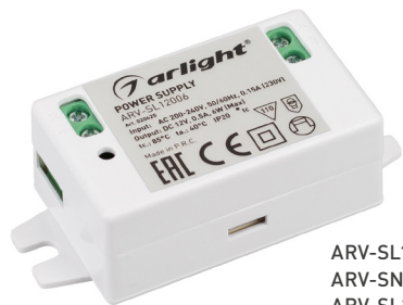
ARV-SL12006 ARV-SN12006-C ARV-SL24006 ARV-SN24006-C