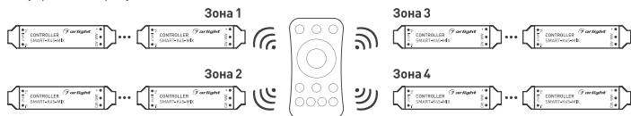
Рисунок 3. Вариант построения системы с 4-зонным пультом дистанционного управления.